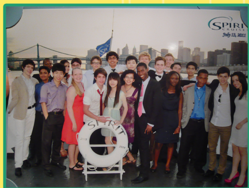
在最後一天遊輪派對的時候與同組的人合影。