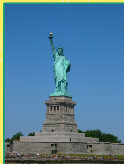
從小船拍到雄偉的自由女神像。