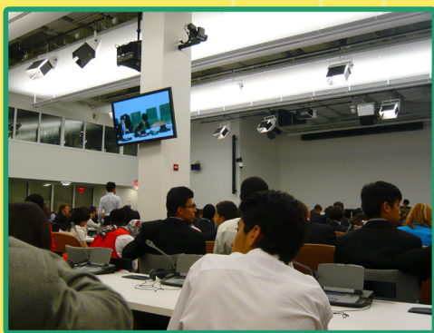
在聯合國大廈裡開會的我們。