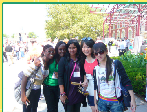
在Ellis Island參觀完博物館和自由女神像之後與剛認識的朋友們合照。