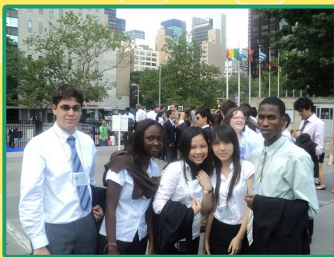
在聯合國大廈外面與世界各國的人留下紀錄。